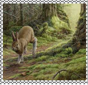
Le lièvre par Pierre Leduc

Pour information: www.presbyteresaintnicolas.com .