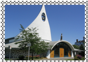
Église de Saint-Nicolas

L'Église actuelle de Saint-Nicolas fut érigée en 1962 à la suite de l'incendie survenu un an plus tôt qui détruisit l'église précédente. Œuvre de l'architecte André Gilbert, son profil, inspiré d'un bateau, rappelle l'importance du fleuve et de la construction navale autrefois présente à Saint-Nicolas. L'intérieur de l'église, exceptionnel au Québec, est doté d'un autel central dont les bancs sont disposés en périphérie. La voûte d'origine possédait des lumières encastrées au plafond représentant les étoiles au-dessus de l'océan.