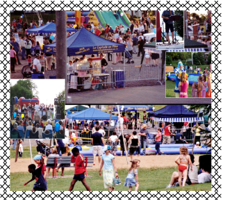
Fête nationale du Québec édition 2009

Cette année encore, RVSN coordonnera les festivités de la Fête nationale du Québec, qui aura lieu le 23 juin prochain au parc Jean-Dumets. Sous le thème Célébrons notre créativité! Venez passer du temps en famille et participer à nos activités créatives dès 17h00 : dessins à la craie sur les chemins du parc, jeux d'habiletés, grande table où vous aurez la chance d'exprimer votre créativité tout en mangeant nos délicieux hot dog! Il y aura aussi des jeux gonflables géants pour les 0 à 12 ans, des spectacles musicaux avec Rodéo Mécanique, Duo jazz Nicolas Dusault et Joanne Métivier et Duo Maude et Gilles ainsi qu'un immense feu de joie allumé par un cracheur de feu!